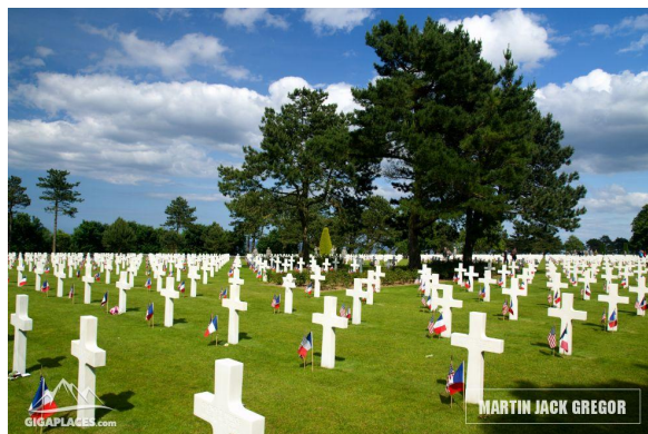
Vylodění v Normandii – pláž Omaha