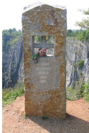
Lomy Amerika 1949 - 1953