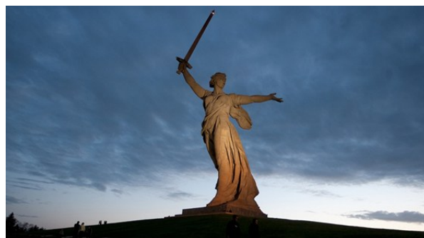
Matka vlast - Mamajevská mohyla