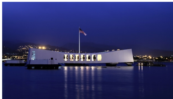
Památník USS Arizona – Pearl Harbour - Havaj