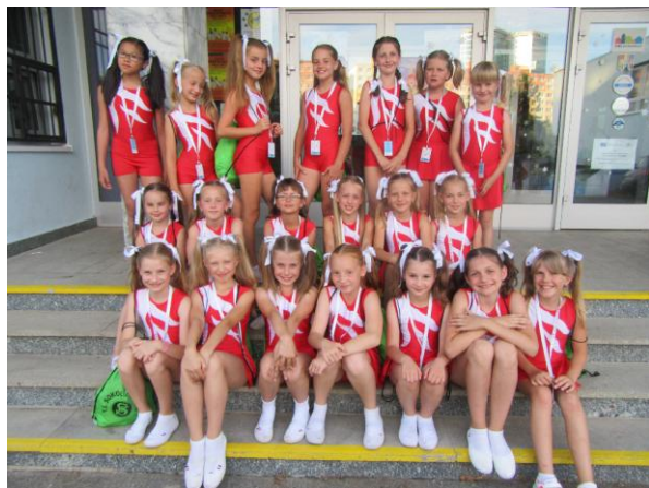
XVI. Všesokolský slet – V peřině