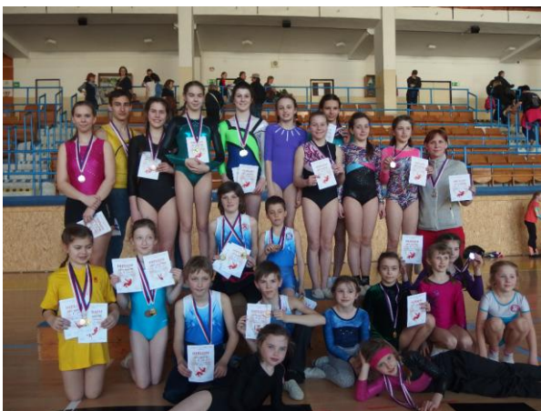
Přebor SŽJ v gymnastice a šplhu

Generálkou na nadcházející sletové léto byla tradiční milevská akademie 19. dubna. Členové se zapojili podle věku do tří sletových skladeb: V peřině, Děti to je věc a Cirkus.