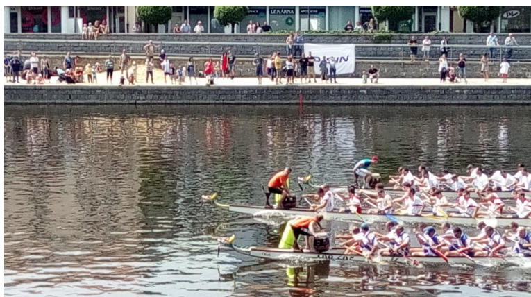
Obrázek 3: Cílová fotka z finále závodu dračích lodí

V závodě na 1000 metrů vybojoval Sokol Písek 2. místo. Závody dračích lodí jsou velmi atraktivní díky velkému množství diváků, protože jsou pořádány v rámci městských slavností Cipískoviště .