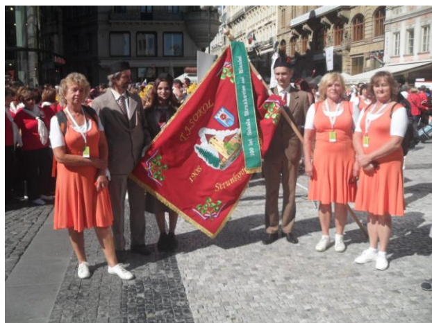
praporečník se cvičenkami před průvodem