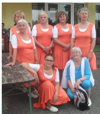
ženy na oblastním sletu v Písku