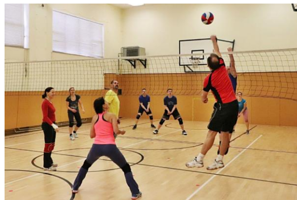
Vánoční volejbalový turnaj 15.12.