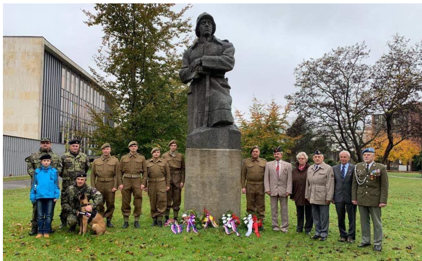
Pieta u Zborovského pomníku