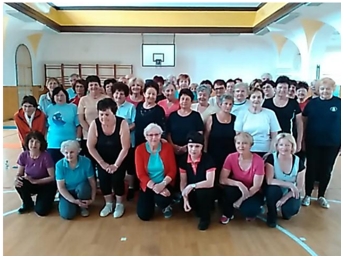
Dopolední cvičení pro seniory

Cvičitelé odboru všestrannosti se zúčastňovali doškolovacích akcí v rámci prodlužování cvičitelských průkazů.