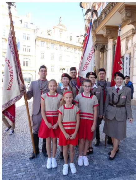
Obrázek 10: Krojovani Sokolové

8) Pochod pro republiku – oslava založení ČSR v Praze (Čudlý)