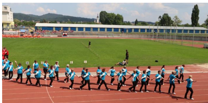
Oblastní slet v Písku 13.5.

V sobotu 9. června se ženy zúčastnily Krajského sletu v Českých Budějovicích , který pořádala Sokolská župa Jihočeská. Úspěch sklidila nejen jejich skladba Cesta, ale i všech dalších deset sletových skladeb. Součástí sletu byl i slavnostní společný nástup ve sletových úborech. K úspěchu sportovního odpoledne přispělo i nádherné letní počasí.