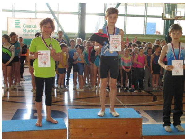
Přebor v gymnastice a šplhu - Písek

Po mnoha letech se družstvo Křemže zúčastnilo i soutěže v TeamGymu (skoky na trampolínce a prostná). V kategorii do 16 let skončilo smíšené družstvo na 5. místě.