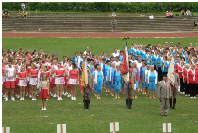
Župní slet - ČB