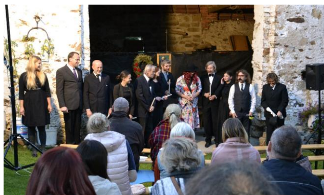
deniéra hry "Truhlíci pozůstalí" ve stodole