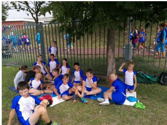
Mladší žactvo v Praze

Poslední hodinu cvičebního roku si chlapci vyjeli na kolech.