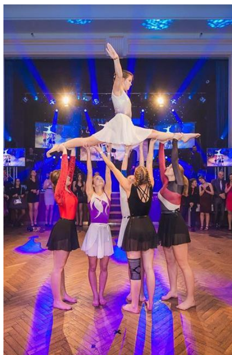
Obrázek 16: Five Fellas a Fearless

Vedle již zmíněných činností proběhly každoročně pořádané akce – četné turistické zájezdy a pochody, bruslení, jarní a podzimní sraz u Hrejkovického potoka, karneval RD a PD, letní loučení se cvičením, drakiáda, výlet za zvířátky, setkání u vánočního stromečku či vandry za krásami České republiky, které nás letos o Velikonocích zavedly do Brd (Hořovice, Valdek, Tok, Houpák, Příbram) a v podzimním termínu 15. až 16. září na Blaník