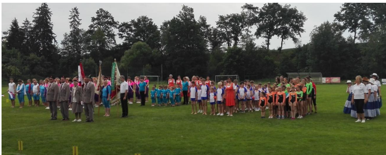
slavnostní nástup při oslavách 110. výročí jednoty ve Strunkovicích nad Blanicí