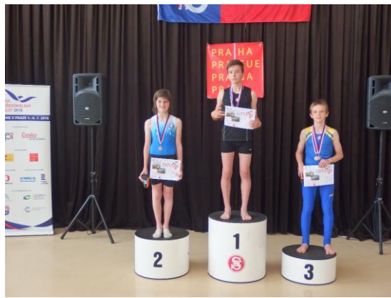
Přebory ČOS žákyně IV, žáci III