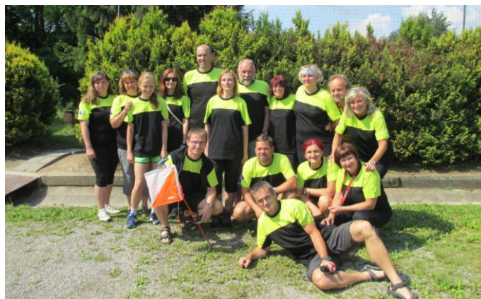
Štafetový závod ČLOBLAN

Pro všestrannost nakoupila jednota dalších 6 nových žíněnek, 5 doskokových dučen, skládací set pro cvičení předškolních dětí a potah kladiny.