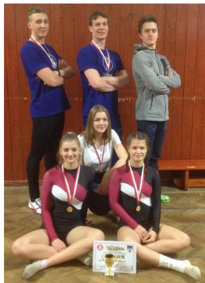
Obrázek 15: Družstva Malého TeamGymu

Začátkem prosince se do našich cvičení přišel na děti podívat Mikuláš s čerty a s andílkem . V oddělení rodičů a dětí a předškoláků všichni předvedli, jak pěkně umí cvičit, mladší žactvo kromě toho také zarecitovalo básničku a za odměnu každý dostal balíček s dobrotami.