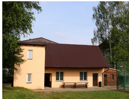
Nová střecha na klubovně