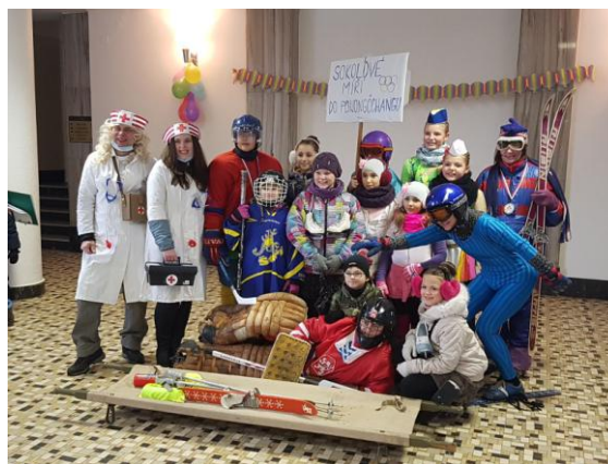
Účast v Milevských maškarách