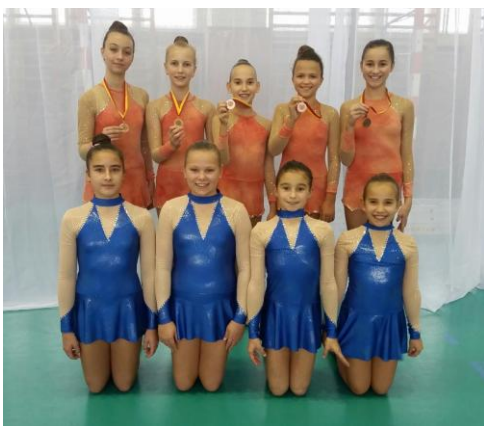
Moderní gymnastky po závodě

Více informací, výsledky a fotografie na webových stránkách T.J. Sokol Milevsko.