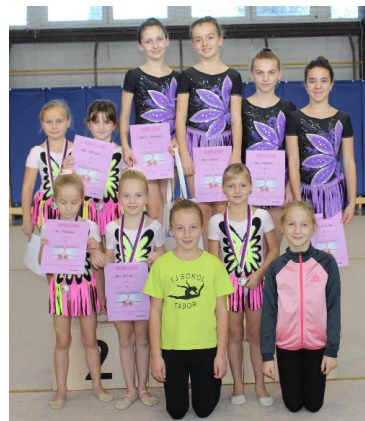
MG – oblastní přebor ve společných skladbách