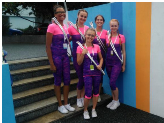
Siluety v Praze

Sportovní oddíly - u ČOS jich bylo registrováno 20: atletika, americký fotbal, badminton, korfbal, horolezectví, nohejbal, kulturistika, stolní tenis, frisbee. Z bojových sportů to byly oddíly karate, capoeira, Iaido-Kendó, kick-box, aikido a tai-chi-chuan. Dále oddíl roztleskávaček – Hell’s Cheerleaders, oddíl sportovního tance, dva oddíly historického šermu a oddíl scénického šermu.