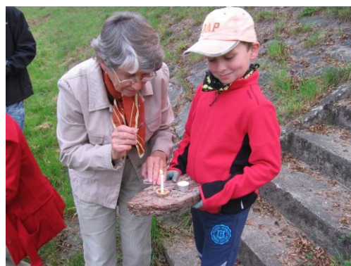
Památný den sokolstva