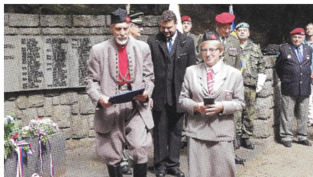
Vzpomínková akce výročí Čsl. legií 29. 6.