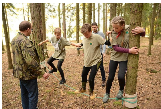
Přebor SŽJ – Kamenný Újezd

Organizačně byla akce bezchybná. Na hladkém průběhu závodu se podílelo na 50 rozhodčích a ostatních organizátorů, perfektní zázemí zajistila T.J. Sokol Kamenný Újezd.