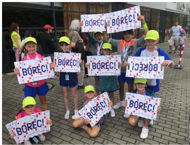
XVI. všesokolský slet Praha

Župní slet Sokolské župy Jihočeské se uskutečnil 9. června. a my jsme se jej zúčastnili se všemi čtyřmi skladbami. Slet začal již v pátek 8. června průvodem. Sobotní program zahájil nástup cvičenek, cvičenců a praporečnicků na stadion. Po tónech české hymny a slovech představitelů župy a hostů vystoupily mažoretky z T.J. Sokol Blatná. Pak stadion patřil všem jedenácti hromadným skladbám. Český rozhlas České Budějovice vysílal živě ze stadionu hodinovou reportáž.