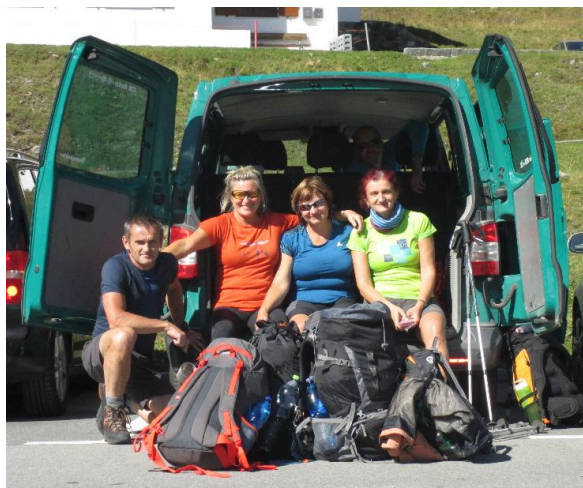
Švýcarsko - Silvretahorn