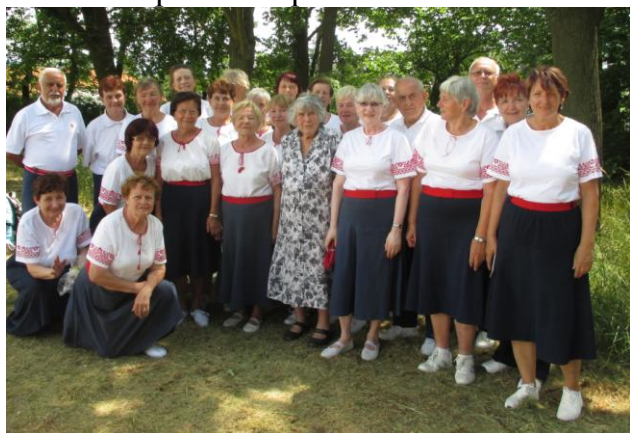
Princezna republika v Klatovech