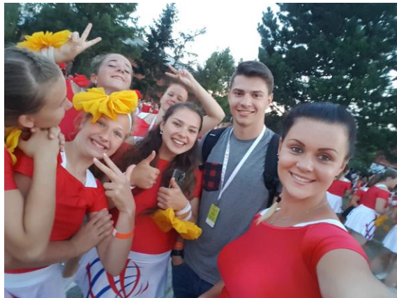
Starší žactvo v Praze