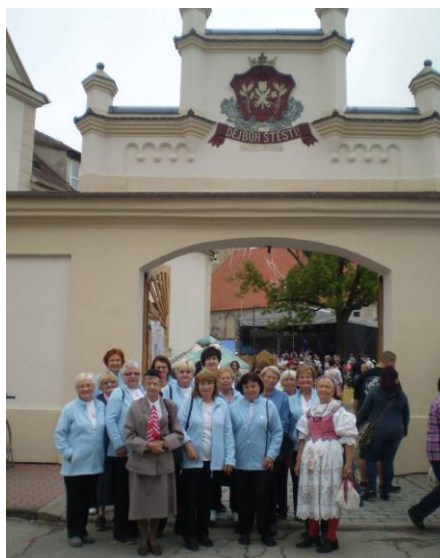
Dožínkové slavnosti v Soběslavi a průvodu městem - 15. 9. 2018