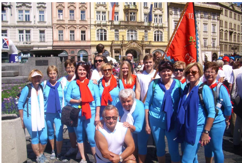
Cvičenci skladby "Spolu" ze Čtyř Dvorů na Staroměstském náměstí.

Vedle zajištění pravidelných hodin a sletových akcí uspořádala jednota tradiční a úspěšnou Čarodějnou noc s táborákem u sokolovny. Děti se zúčastnily atletických závodů na Sokolském ostrově. Veřejné cvičební hodiny jednotlivých oddílů dětí v prosinci v rámci Mikulášské nadílky se setkaly s velmi příznivým ohlasem ze strany rodičů. Podobnou akci uspořádal i oddíl Kendó. Rok zakončili členové jednoty tradičním „Zdobením vánočního stromu v lese“.