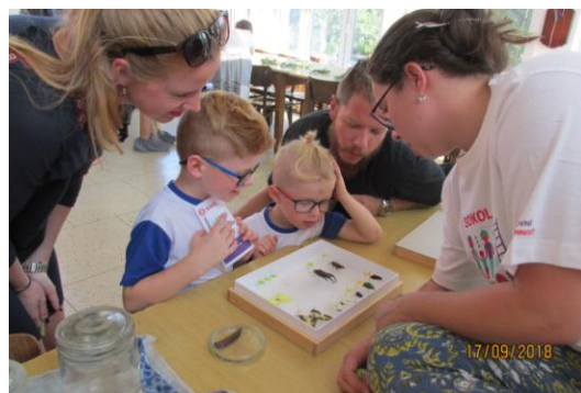
Cesta za poznáním