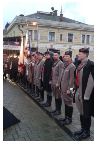
Vítání TGM 2018