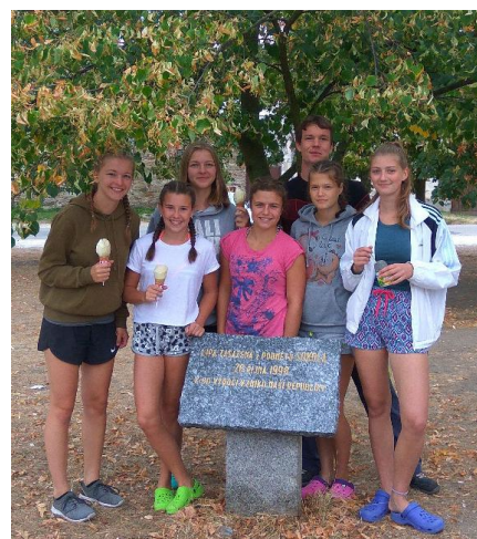
Obrázek 12: Letní soustředění