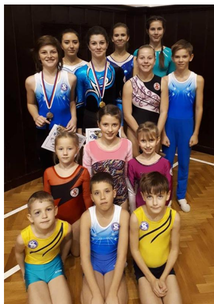
Memoriál Ády Hochmanna