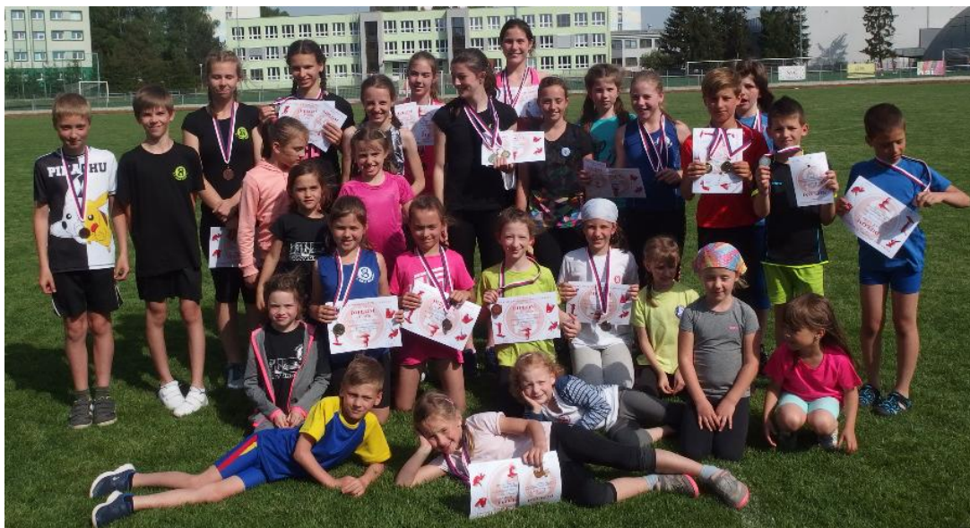
Župní přebor atletika