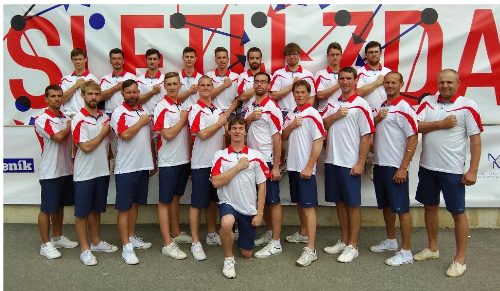
Obrázek 9: Písečtí Borci