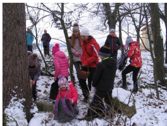
Vánoce pro zvířátka

Mnoho dětí i dospělých podniklo Silvestrovskou vycházku do bližšího i vzdálenějšího okolí Volyně.