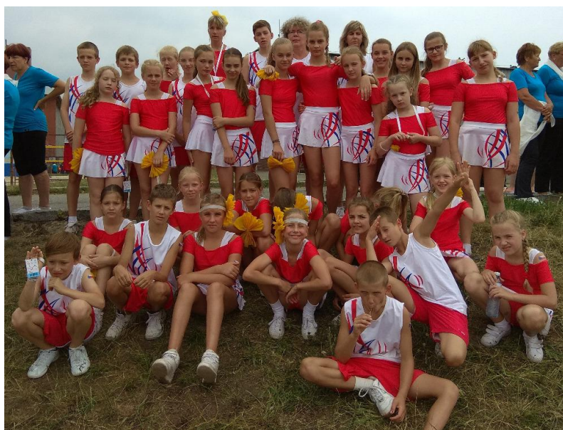
Obrázek 7: Mladší a starší žactvo ze skladby Cirkus