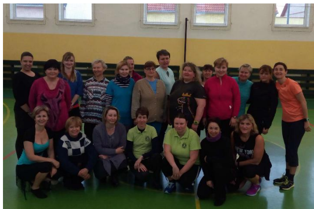
Tanec je život - seminář