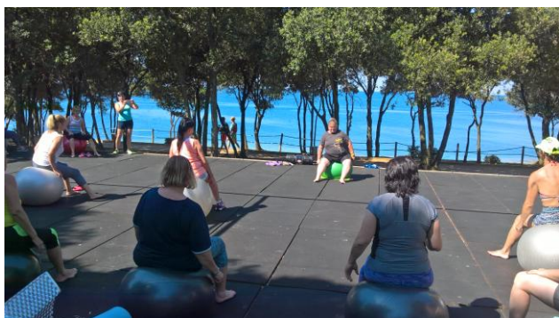
Cvičení v Chorvatsku