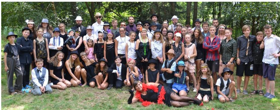
Mafiáni na táboře

Týdenní dětský tábor Rosička pro 27 dětí, 13 rádců a 17 dospělých začínal 11. srpna velkým táborákem pro rodiče. Celý týden si všichni užili v přírodě: koupali se v potoce, hráli spoustu her, bojovali v etapové hře, zvládli diskotéku, uspořádali sportovní turnaj v baseballe, podnikli výlet do okolí. Samozřejmě museli všichni i trochu pracovat – připravovat dřevo, aby kuchaři měli čím topit pod kamny. V etapové hře mezi sebou soupeřily 4 mafiánské rodiny. V jednotlivých etapách získávaly peníze, aby si pak mohly koupit část města a rozšířit tak svůj vliv. Samozřejmostí byla návštěva kasina, střelba ze vzduchovky, kreslení kopií drahých obrazů, následně vydražených. Děti se nevyhnuly ani vaření nebo luštění šifer a morseovky. V závěrečné etapě došlo na velký souboj se zrádci mafiánských rodin, který dopadl pro všechny děti úspěšně. Jejich vedoucí pak ovládli celé město.