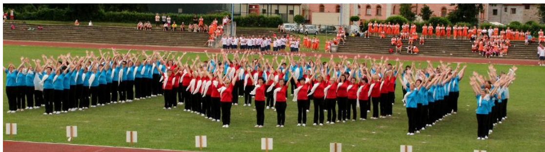
Župní slet v Českých Budějovicích 9.6.

V sobotu 9. června se ženy zúčastnily Krajského sletu v Českých Budějovicích , který pořádala Sokolská župa Jihočeská. Úspěch sklidila nejen jejich skladba Cesta, ale i všech dalších deset sletových skladeb. Součástí sletu byl i slavnostní společný nástup ve sletových úborech. K úspěchu sportovního odpoledne přispělo i nádherné letní počasí.