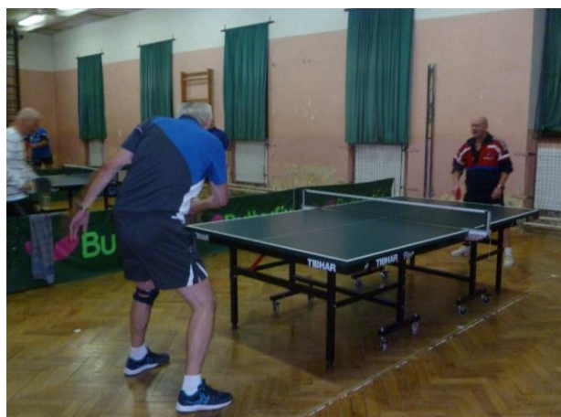
Turnaj ve stolním tenise

Soubor loutkového divadla – měl v období říjen – duben v lišovském kině vyhrazeno každý měsíc jedno nedělní odpoledne. Děti se vždy těšily na pohádku, a proto bylo pokaždé plně obsazené hlediště. Členové souboru loutky vodí i mluví a starají se také o jejich opravu a opravu kulís. Díky dotaci z města a peněz od sponzorů mohli pořádit i nové loutky a kulisy.