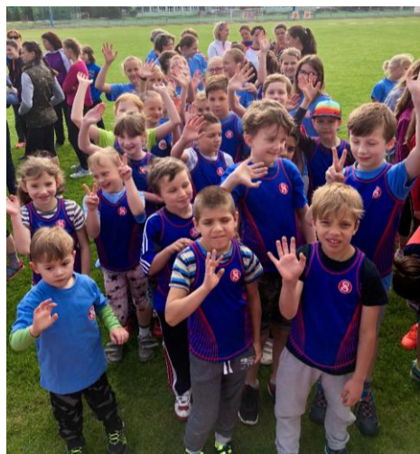
Župní přebor v atletice

Dětský den spojený se Závěrečnou hodinou oddílů se konal 6. června. Děti skákaly přes švédskou bednu, houpaly se na kruzích či na laně, malovaly nekonečné omalovánky, hrály si s míči... Na závěr dostaly odměnu.