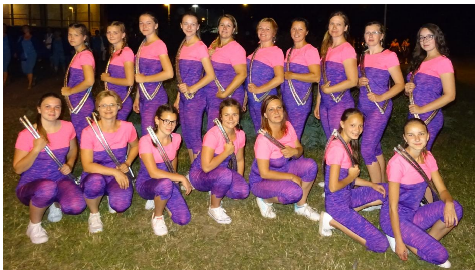
Obrázek 6: Písecké Siluety

vyzkoušely ještě s ostatními jednotami na sletech v Písku, Českých Budějovicích a Voticích a pak už jsme vyrazily v plném počtu do Prahy. V neděli jsme se zúčastnily sokolského průvodu a pak nacvičovaly až do středy choreografii na stadionu Eden, kde proběhlo vyvrcholení celého našeho snažení. Skladba Siluety přilákala tolik cvičenek, že jsme se nakonec musely rozdělit a část z nás cvičila pouze ve čtvrtek, abychom se prostřídaly s ostatními, které také chtěly předvést, co se naučily. Celý slet jsme si moc užily, zažily jsme spoustu legrace, potkaly spoustu nových lidí a už se zase těšíme na další všesokolský slet.“