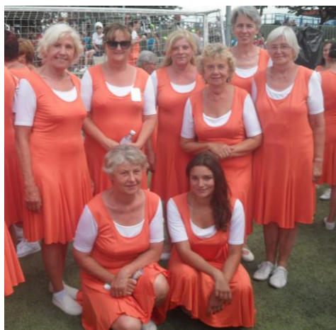
ženy na nástupišti v Edenu