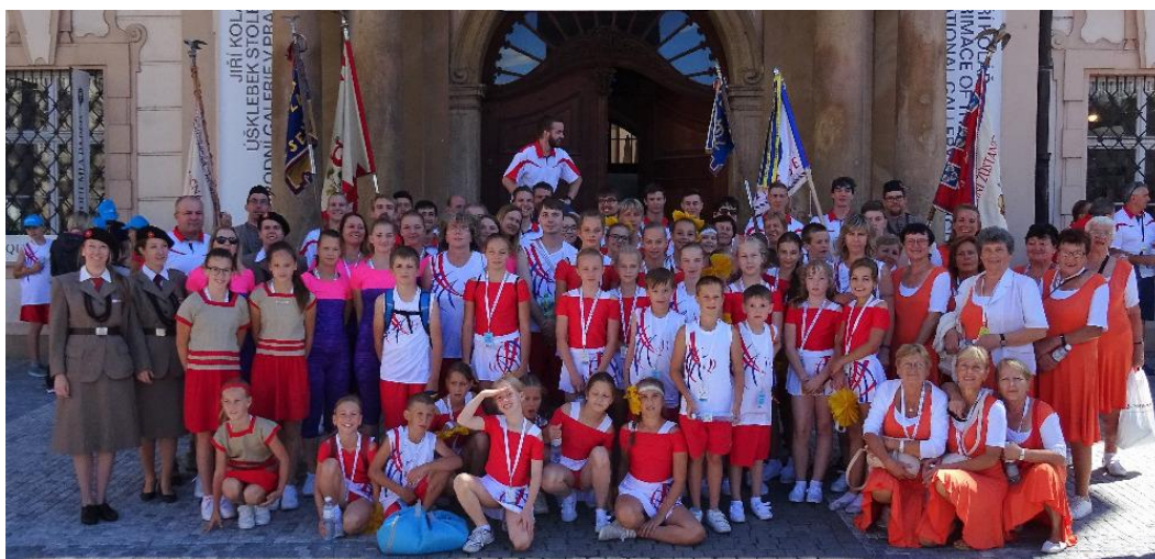
Obrázek 17: Odbor všestrannosti – cvičenci na Sletu

nejrůznějších akcí, za jejich užitečnou a záslužnou práci, kterou pro Sokol dělají a popřát jim spoustu sil a především nadšení do dalších let.