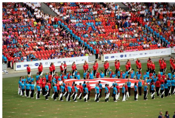
XVI. všesokolský slet Praha 1. – 6.7.