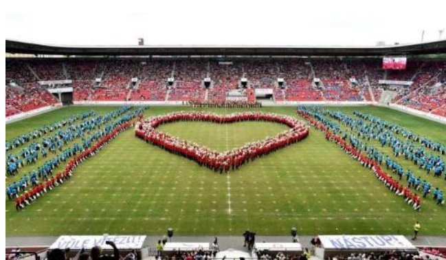
Sletová skladba Cesta

Pro předškoláky a sportovní přípravku byly uspořádány Šibřinky, Den dětí, Mikulášská nadílka a Vánoční besídka.