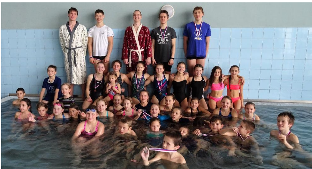
Obrázek 1: Župní přebor v plavání