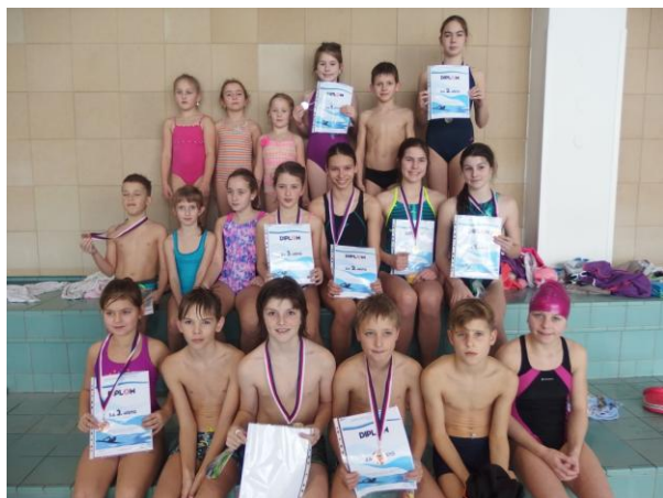
Přebor SŽJ v plavání