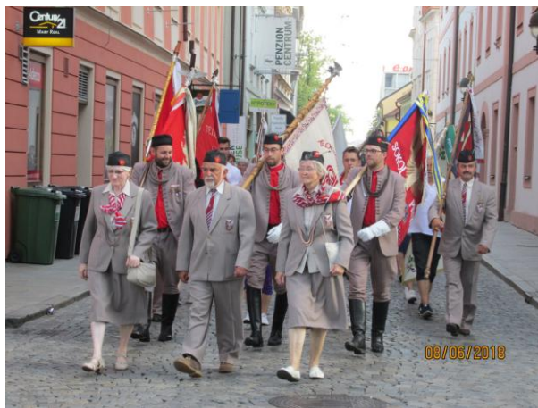
Župní slet – průvod městem