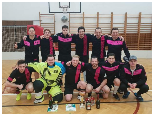
Vítězný tým florbalového turnaje

Florbal – družstvo florbalu stále hraje soutěž Regionální liga mužů jižní Čechy a Vysočina, takže jezdilo na zápasy i mimo Jihočeský kraj. Zájemců o florbal by bylo hodně, ale z finančních důvodů mohlo být registrováno pouze jedno družstvo. Bohužel, naše tělocvična nemá požadované parametry na florbalové zápasy, takže si florbalisté museli objednávat na tréninky i na utkání halu v Č. Budějovicích, což je finančně velice nákladné. Konec prosince patřil tradičnímu turnaji, kterého se zúčastnila družstva z blízkého i vzdálenějšího okolí.