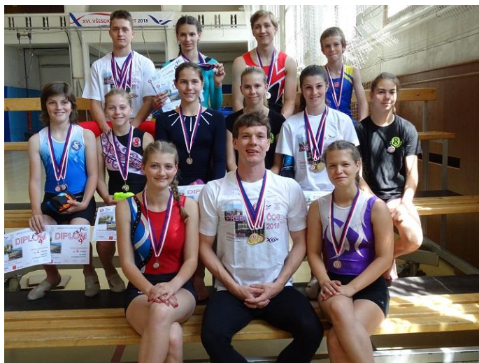
starší žactvo, dorost a dospělí