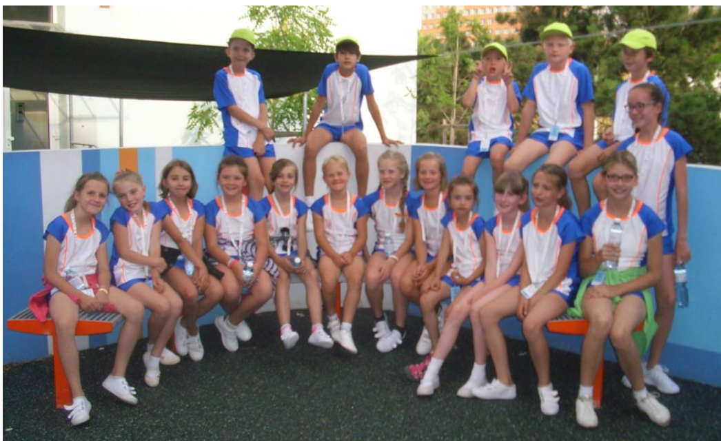
Cvičenci skladby "Děti to je věc" z jednot Čtyři Dvory a České Budějovice.