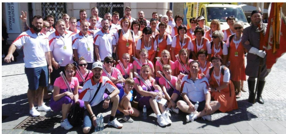
Ukončení sletového průvodu na Staroměstském náměstí

Odbor všestrannosti měl tři oddíly: nejmladší žákyně, ženy a muže. Děvčata hrála různé hry, seznamovala se s náradím a učila se tancovat. S country tanečkem „Zuzana“ vystoupily žákyně na vernisáži výstavy „Sport v Lišově“ a na Lišovských slavnostech. Ženy využívaly při cvičení pro správné protažení těla různé náčiní – gymbaly, overbaly nebo válce. Uspořádaly i velmi oblíbené víkendové turistické akce. Muži se rozdělili na dvě party - mladší hráli florbal a posilovali, starší generace hrála různé míčové hry. Samozřejmě vyrazili společně v zimě na Šumavu na lyže a v létě na Vltavu na lodičky.