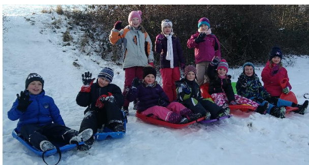
žactvo – pohybové hry