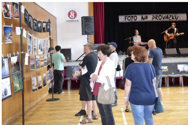
18. ročník výstavy Foto na provázku

Osmičková a kulatá výročí byla oslavována i v rámci jednoty. Již XVIII. ročník měla 2. – 3. 6. ve Strunkovicích celostátní fotografická soutěž Foto na provázku s bohatým doprovodným kulturním programem, na které vystavovalo 38 fotografií. Desátým rokem pracoval divadelní soubor Strunkovický ochotnický spolek , který nacvičil a veřejně sehrál již 6 divadelních kusů. Jeho fotografii jsme mohli všichni zhlédnout v Sokolském kalendáři 2018 i na výstavě „Ni zisk, ni slávu“ v Tyršově domě v Praze. 2. 6. oslavila strunkovická jednota 110. výročí od svého založení. Ve sportovním areálu zacvičili kromě místních také cvičenci z devíti sokolských jednot (České Budějovice, Čtyři Dvory, Jindřichův Hradec, Kamenný Újezd, Písek, Vodňany, Volyně, Strunkovice a Vřesovice na Moravě) celkem pět sletových skladeb. Poprvé byl veřejnosti představen nový vyšitý sokolský prapor, na který připevnil pamětní stuhu za ČOS starosta Prostějovské župy bratr Svatopluk Tesárek.