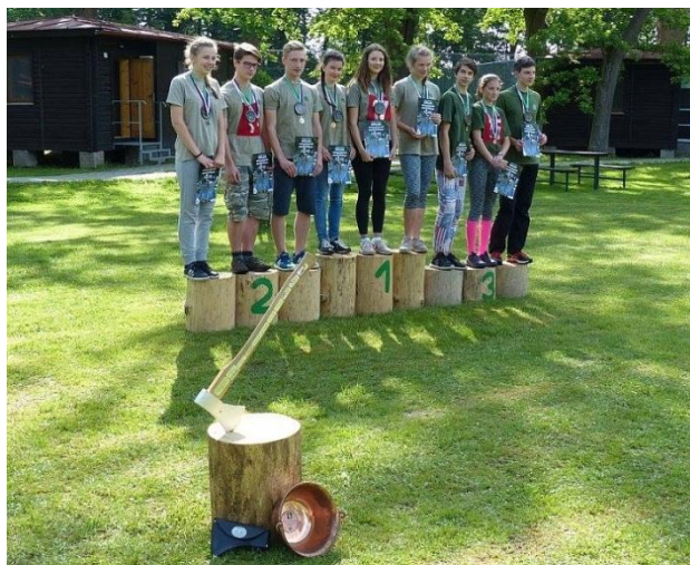
Přebor ČOS – Doubí u Třeboně

Přebor ČOS v ZZZ 2018 uspořádala SŽJ ve dnech 18. - 20. května ve středisku Doubí u Třeboně. Organizačně jej zajistili zejména členové oddílů pobytu v přírodě z jednot České Budějovice, Kamenný Újezd a Lišov. Závodu se zúčastnilo 38 tříčlenných hlídek ze 14 žup (21 jednot). Na sedmikilometrové trati, vedené lesy a po rybníčních hrázích, bylo nachystáno 22 disciplín. Po závodu žáků a dorostu odstartoval závod dvoučlenných hlídek dospělých, kterého se zúčastnilo devět hlídek. Celý závod i doprovodné programy byly připraveny velmi pečlivě, zajímavě a inspirativně, proto i ohlasy z řad přeborníků byly kladné. V kategoriích žactvo i dorost vybojovaly shodně zlato i stříbro hlídky T.J. Sokol Kamenný Újezd, skvěle reprezentovaly SŽJ.