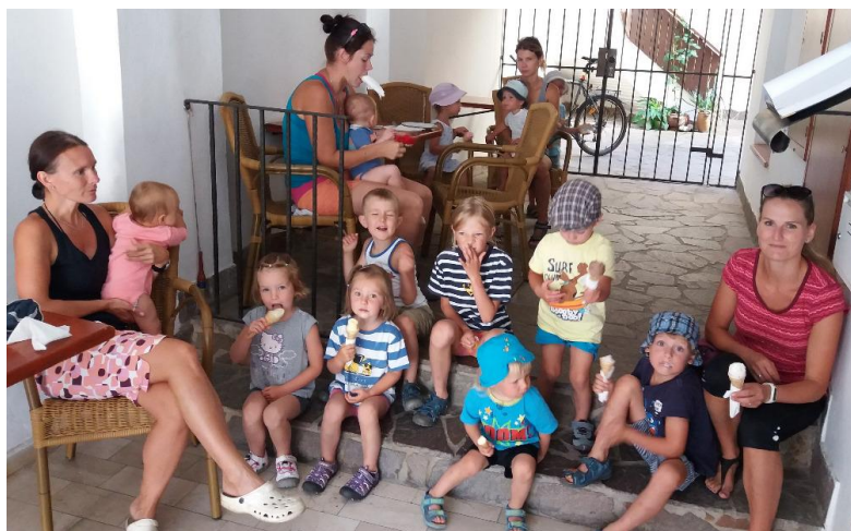
Obrázek 11: Rodiče a děti na pobytu v Suchdole

Poslední týden v srpnu proběhlo letní soustředění skupiny nejstarších dívek. Hlavní náplní první poloviny týdne byla párová akrobacie, posilování a různé sporty jako volejbal, lezení či gymnastika. Druhá polovina týdne byla více oddechová a nesla se v duchu vodáckém. Dívky vyměnily tělocvičnu za naši krásnou řeku Otavu a vydaly se na dvoudenní plavbu ze Sušice do Katovic, kterou zakončily sladkou odměnou v podobě výborné zmrzliny.