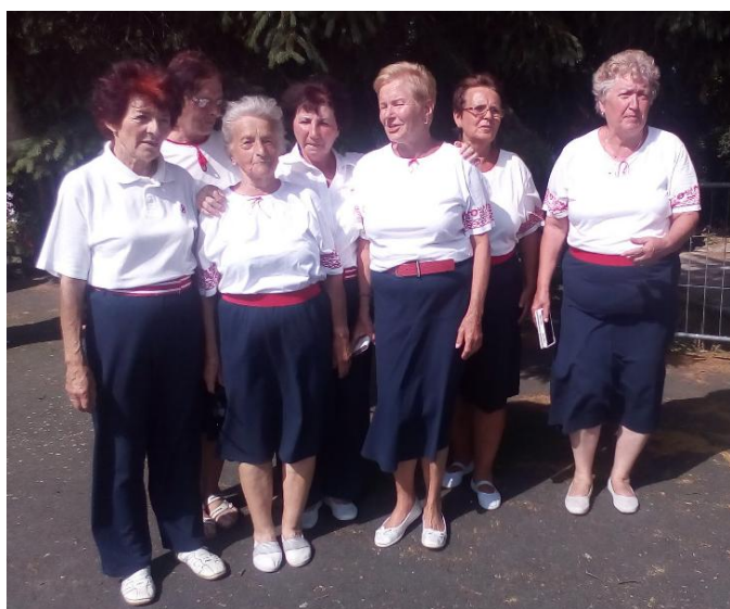
Sletová skladba Princezna republika

Rok 2018 byl sletovým rokem a naše jednota byla zastoupena v pěti sletových skladbách, které odcvičila na sletech v Praze, Českých Budějovicích, Voticích, Písku, Klatovech a Strunkovicích nad Blanicí.