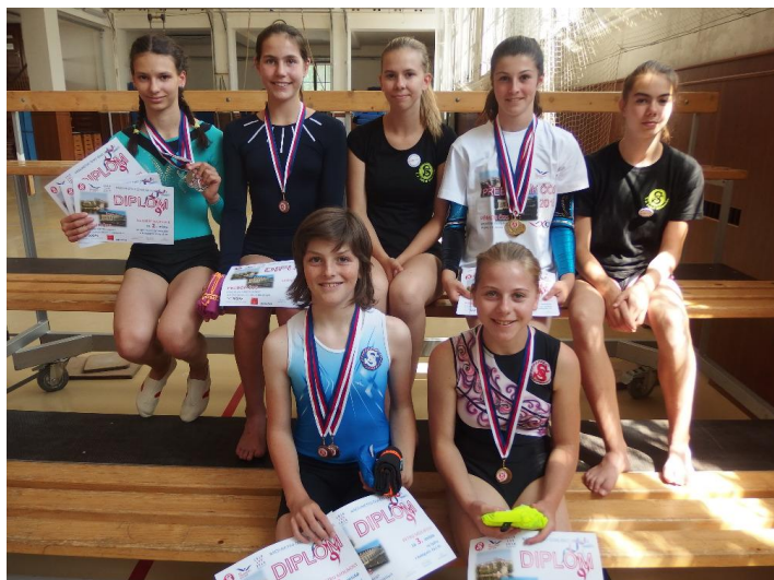
Přebor ČOS Praha