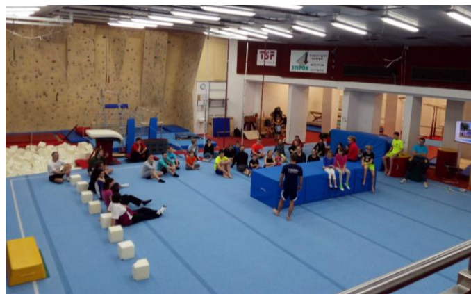
Seminář SG v Č. Budějovicích