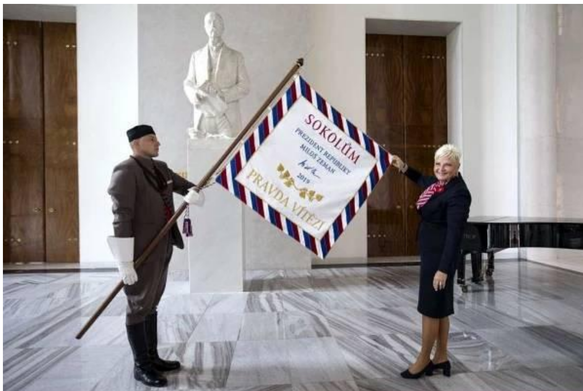
Starostka ČOS se zástavou, věnovanou prezidentem republiky