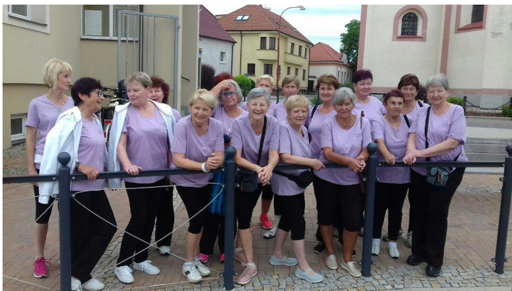
TJ Sokol Rudolfov – Rudolfovské slavnosti 2019

Nazdar sestry a bratři, chtěla bych Vám přiblížit naši Tělocvičnou jednotu Sokol Rudolfov - ženy. Ano, v naší jednotě jsou pouze ženy. Je nás 32 žen z Rudolfova, Adamova, Hůr ale i z Českých Budějovic. Některé ženy zde vyrůstaly, některé i žily a tak se vrací si u nás zacvičit. Nejsme sice již nejmladší, i když jsou tu mladší. Stále máme hodně chuti do cvičení. Mezi tím jezdíme na výlety, provozujeme turistiku po českobudějovicku, ale i po naší republice. Navštěvujeme společně divadlo nejen v Č. Budějovicích. Cvičíme jednou týdně - na fitballech, s overbally, s gumou, ale i joga plus prostrná.