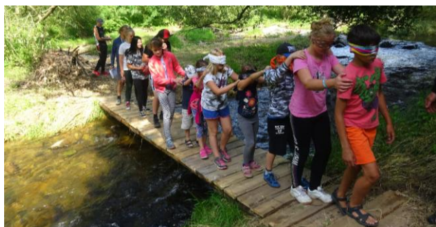
Letní tábor pod Bethánem

V rakouském Dornbirnu se 7. - 13. července konala XVI. světová gymnestráda , které se zúčastnilo více než 18.000 cvičenek a cvičenců z 69 zemí celého světa. Heslem bylo "Show your colours!", tedy Ukažte své barvy. V české výpravě, čítající na 870 žen a mužů, byli samozřejmě zástupci Sokola, a to se dvěma hromadnými skladbami (Spolu a Borci) a jedním pódiovým vystoupením (Pojďme nabarvit svět). Z naší jednoty jelo do Dornbirnu 7 žen a 2 muži, kteří cvičili ve skladbě Spolu, tj. česko-slovenské skladbě loňského sletu. Celý týden byl náročný, ale plný dechberoucích zážitků.