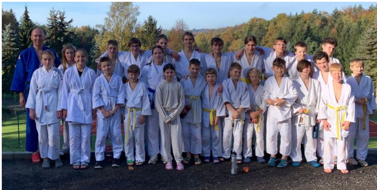
Soustředění na Mozolově